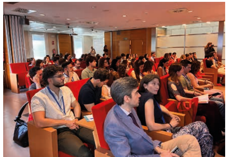
Vista parcial de los asistentes a este Curso conjunto de AJOE y la SEO.

Como Product Manager de la línea de refracción e IMAGEnet