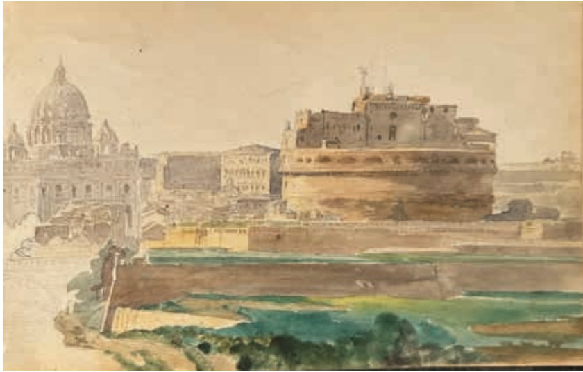
Castillo de Sant'Angelo, Vaticano, 1853-53. Acuarela sobre papel, 14,2 x 21,5 cm.

Universidad Complutense de Madrid y, en menor medida, de los archivos de Xàtiva, Valencia, Alicante, Barcelona, Madrid, Roma y Bolonia.