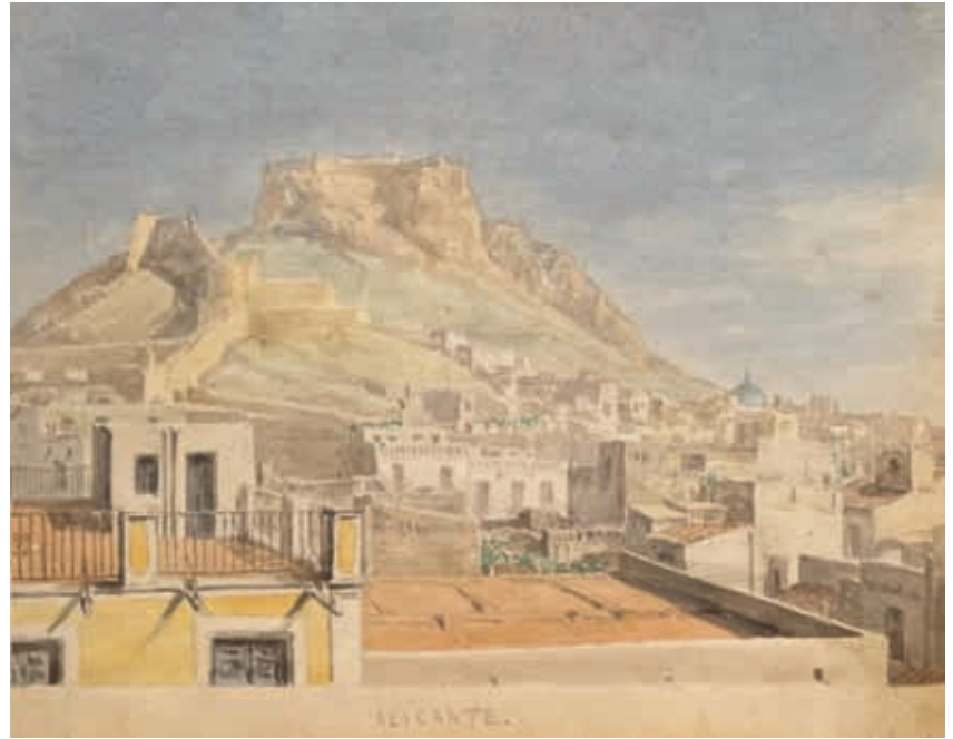
Vista del castillo de Alicante. Acuarela sobre papel, 14,2 x 21,5 cm.

Tenemos que indicar que la correspondencia, así como partidas eclesiásticas, prensa u otros documentos que hemos utilizado en la confección de esta obra y que hemos podido leer, a veces con mucha dificultad, las hemos transcrito totalmente, intentando que este toda disponible al alcance del lector. Hemos intentado reproducir tal y como estaba cada una de dichas misivas para que el lector pueda leer lo más aproximado al original. Todo ello con la finalidad de aproximarnos a la realidad de los protagonistas de este estudio. Es decir, no hemos realizado ninguna corrección a las mismas, y, en el caso de palabras no legibles o que faltaban por alteraciones del papel que las contenía, se ha indicado en el texto. Igualmente hemos reproducido todas las ilustraciones que Ramón, fundamentalmente, aportaba a dicha correspondencia. Algunas de las cartas han sido reproducidas fotográficamente para que el lector pueda observar la caligrafía de sus autores.