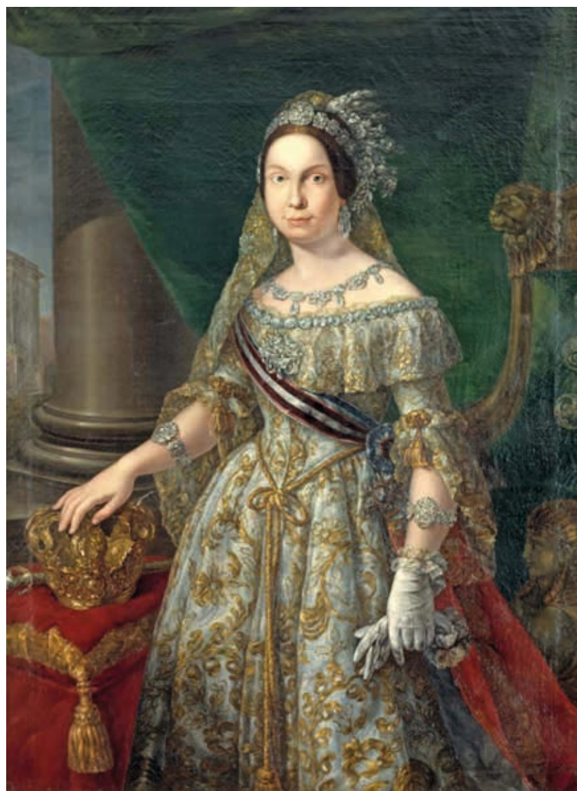
Retrato de Isabel II. 1844. Autor: Ramón Simarro Oltra. Óleo sobre tela, 122 cm x 84 cm.