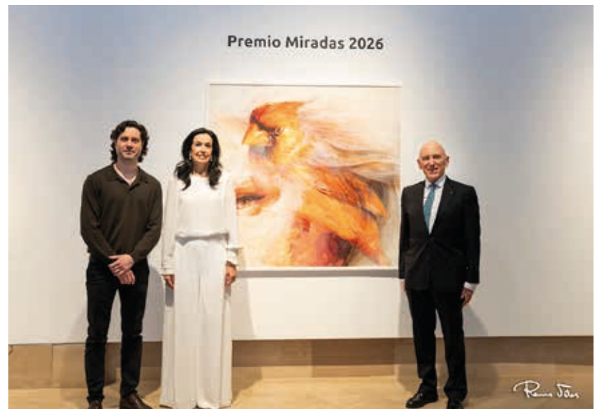
Premio Miradas 2026.