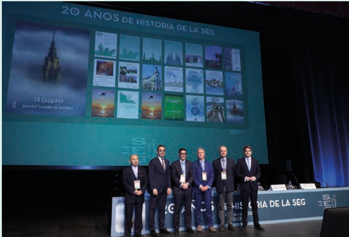
Págs. 3 a 8

EL XX Congreso de la Sociedad Española de Glaucoma (SEG), que se celebró en el Palacio de Congresos de Toledo, El Greco, entre el 12 y el 14 de marzo, ha marcado un hito. Primero, por iniciarse coincidiendo con el Día Mundial del Glaucoma, como evidenciaron esa noche los múltiples edificios de la ciudad teñidos de verde, con motivo de dicha conmemoración y del Congreso de la SEG. Segundo, por el acertado homenaje que se realizó a la actividad de la Sociedad durante estos últimos 20 años, reflejado a través de los 14 carteles conmemorativos preparados para la ocasión. Tercero, por la aprobación de unos nuevos Estatutos. Y, finalmente, por el desarrollo de un exitoso programa científico que ha dejado el listón muy alto para la convocatoria de 2027, que tendrá lugar en Madrid.