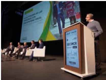
Foto durante la intervención de la ONCE.