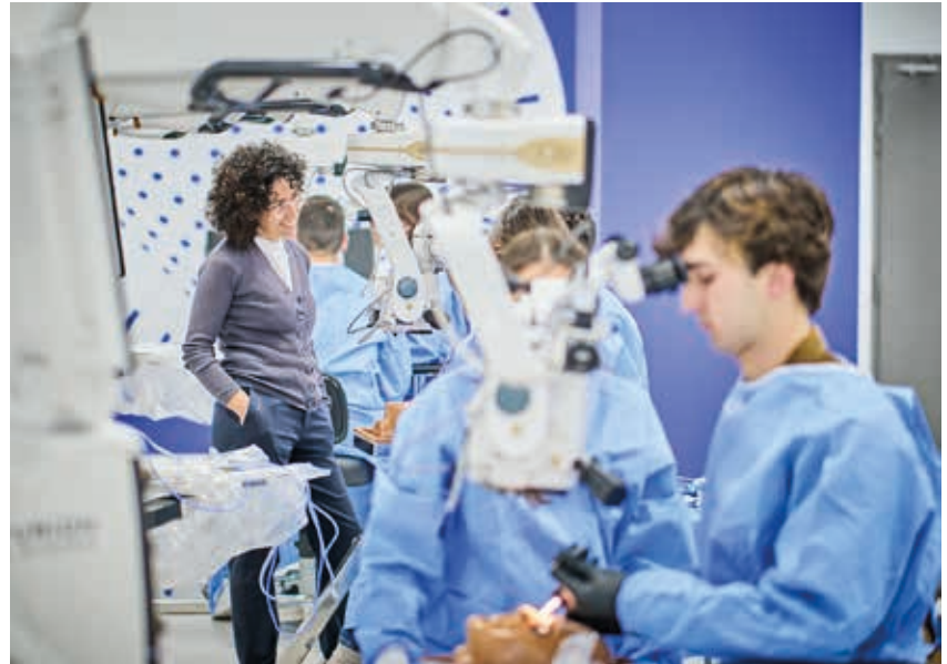
Foto de los residentes en el Alcon Training Center de Madrid.