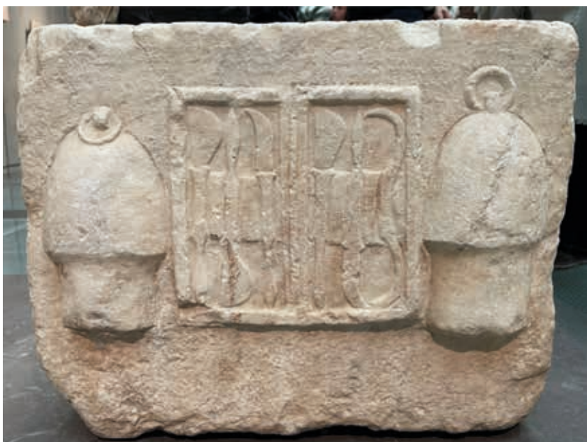
Instrumentos médicos de Asclepio. Pueden apreciarse dos recipientes en los laterales y un maletín abierto en el centro con diferentes instrumentos médicos como escapolos y lancetas. Museo de la Acrópolis. Atenas.