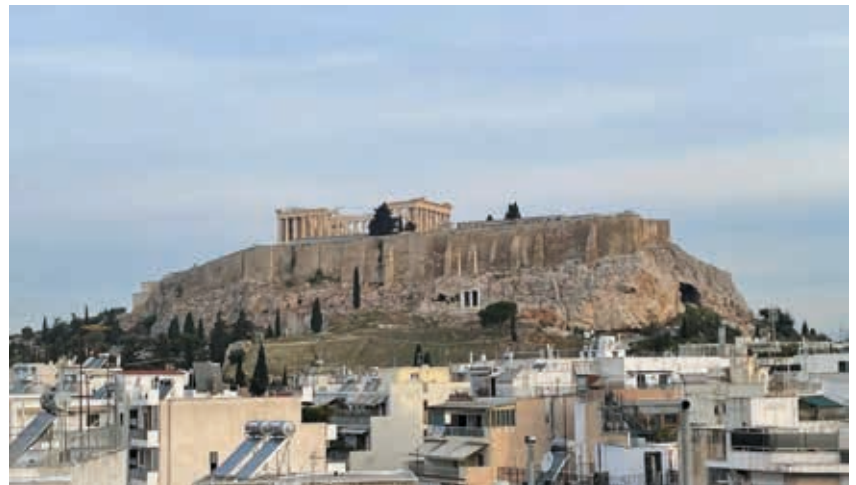
Acrópolis de Atenas. Acrópolis significa la parte más alta de la ciudad y en ella se situaba el antiguo museo construido entre 1865 y 1874 hasta la inauguración del nuevo centro en el año 2009.