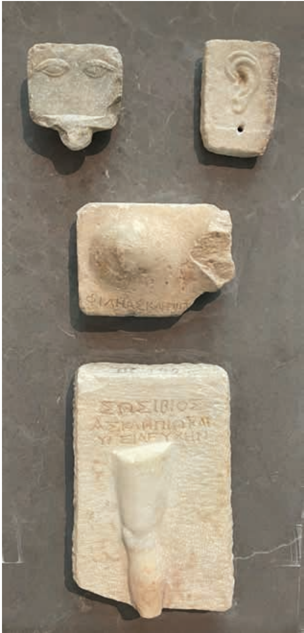
Exvoto u ofrenda votiva del Asclepión de Atenas. Relieves votivos con inscripciones referentes a distintas partes de la economía: ojos, oídos, pecho y pierna. Museo de la Acrópolis. Atenas.