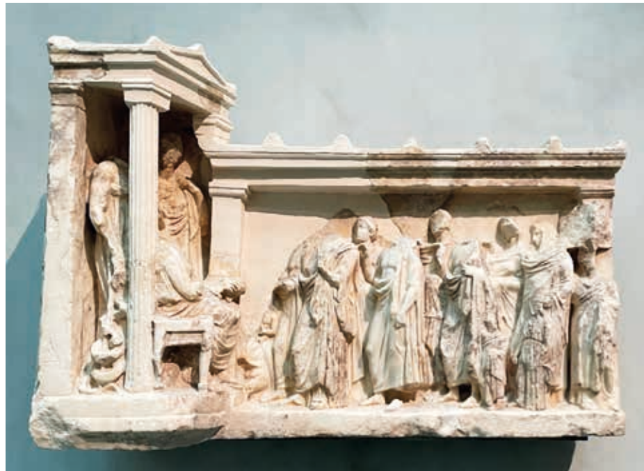
Asclepio en el templo con su esposa Epíone y su hija Higea reciben ofrendas de los fieles. En el inicio de la procesión un joven esclavo lleva un cerdo para el sacrificio. Museo de la Acrópolis. Atenas.