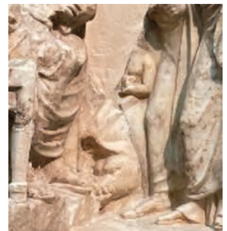
Detalle: En el inicio de la procesión un joven esclavo lleva un cerdo para el sacrificio. Asclepio en el templo con su esposa Epíone y su hija Higea reciben ofrendas de los fieles Museo de la Acrópolis. Atenas.

Vagabundeando por Atenas. Verano de 2024