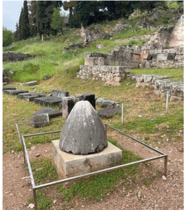
Ónfalo u ombligo del mundo. Betilo o piedra sagrada depositada por Zeus en el centro del mundo en el oráculo de Delfos. Fotografía del autor.