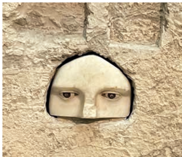
Detalle: parte de un rostro femenino con ojos incrustados. Ofrenda votiva del Asclepión de Atenas. Posiblemente del escultor Praxias. Museo de la Acrópolis. Atenas.