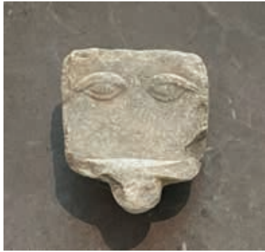
Detalle del relieve votivo: ojos. Exvoto u ofrenda votiva del Asclepión de Atenas Museo de la Acrópolis. Atenas.