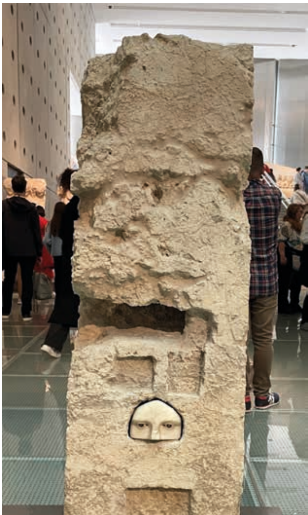
Ofrenda votiva del Asclepión de Atenas. Pilar con ofrendas a Asclepio insertado en el nicho del santuario de Asclepio. Posiblemente del escultor Praxias. Museo de la Acrópolis. Atenas.