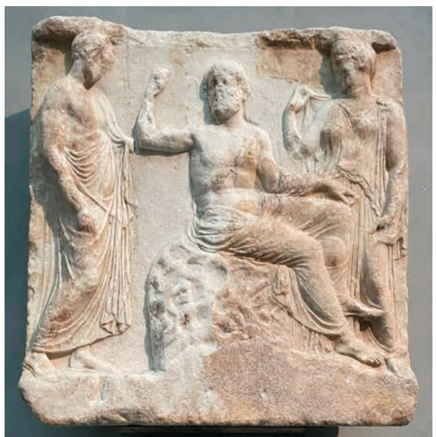
Asclepio sentado en la piedra sagrada u ónfalo entre su esposa Epíone (a su izquierda) y un hombre desconocido vestido con himatión (manto de gran amplitud que se enrollaba sobre un hombro sin fijación, a diferencia de la clámide). Museo de la Acrópolis. Atenas.