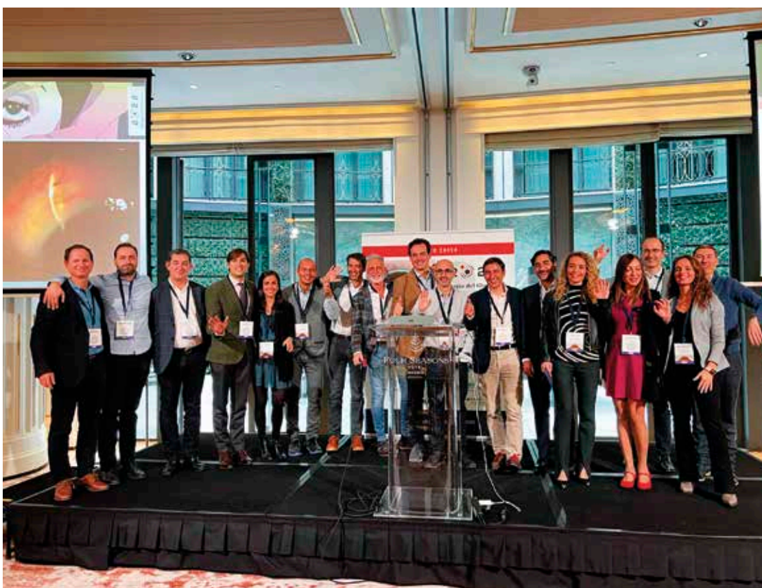
Ponentes del V Curso de Cirugía Del Glaucoma.

Había muchísimas ganas de reencuentro, muchas ganas de verse las caras, aunque fuera con mascarilla y sobre todo ganas de volver a retomar la vida de cursos y congresos, pero la pandemia no había acabado y la organización del evento tuvo que pedir máxima colaboración en el cumplimiento de las medidas anticovid a todos los asistentes doctores, industria, staff. Segundo Óscar a la responsabilidad de más de 200 personas, que se reunieron y cumplieron con todas las medidas, gracias a las cuales no se produjo ningún contagio.