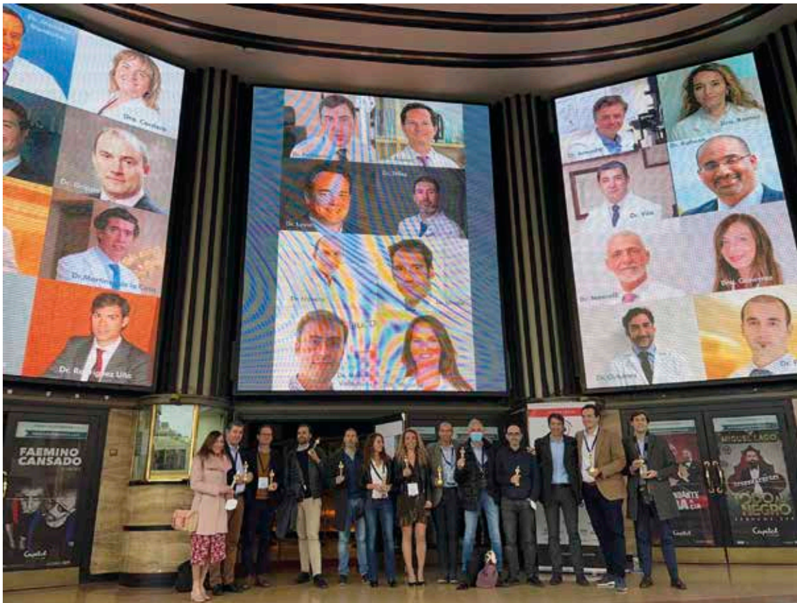
Ponentes y Oscarizados en la entrada del Cine Capitol.