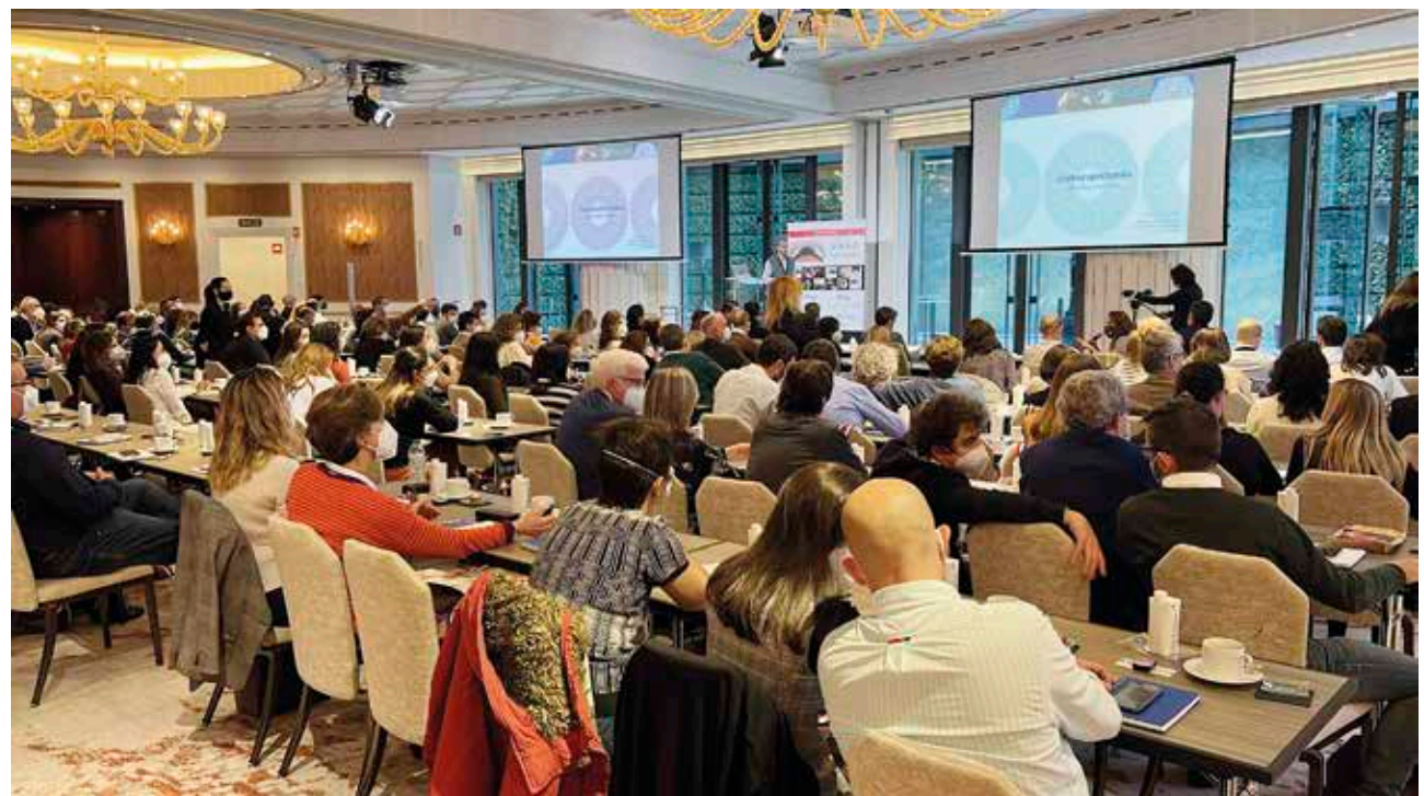
Primer día en la sala Sol Ballroom, los asistentes disfrutaron de las sesiones interactivas.

Y llegó el año 2022, la incertidumbre sobre si se podría celebrar un curso presencial estaba sobre la mesa, y no la de quirófano precisamente. Con