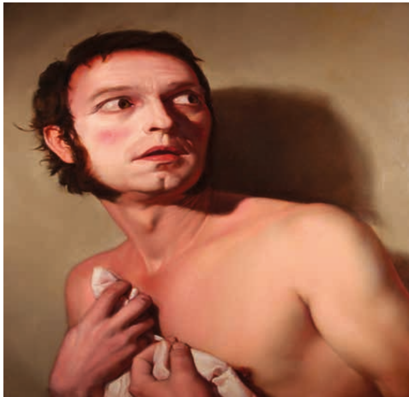
«Leucipo». Manuel Páez Álvarez.

Durante los 25 años de la historia del Certamen han participado más de 2.500 artistas, se han premiado 70 obras y se han realizado 20 exposiciones itinerantes, cuatro de ellas fuera de España en Milán.