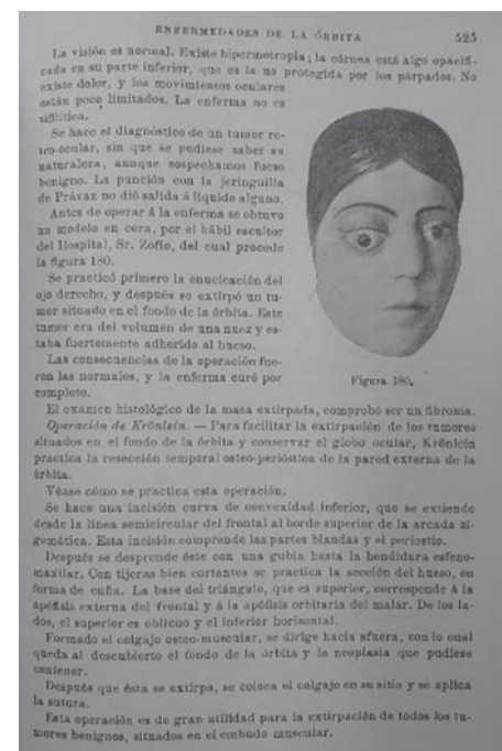
Figura 3. Pág. 525. Tratado Elemental de Oftalmología. 1905.