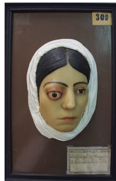
Figura 1 Fibroma de la órbita.