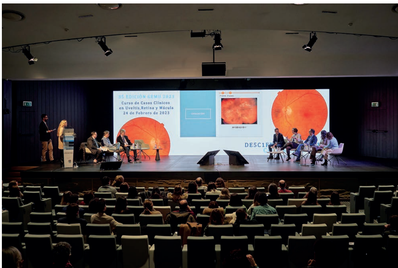
Vista general de la sala durante la reunión.