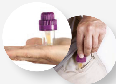
Dispensador de 3 días de uso