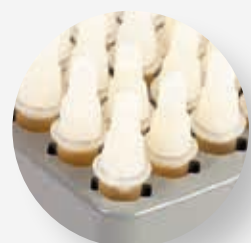
32 dispensadores · Tratamiento 3 meses